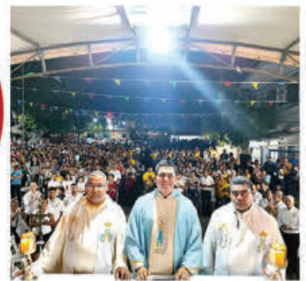
Los sacerdotes durante la Alborada en honor a la Virgen de Lourdes, patrona de los cholomeños.