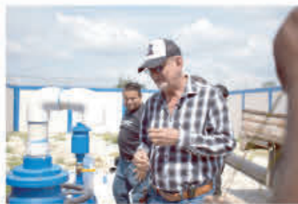
Alcalde presidente del consejo