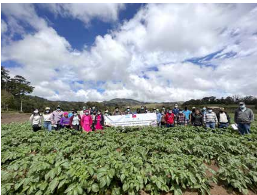
Miles de agricultores y agricultoras rurales mejoran su vida con los Proyectos que implementa la Misión Técnica de Taiwán.

Los productores y productoras del campo, enfrentan a diario grandes retos para lograr hacer producir la tierra, elevar el nivel de productividad, optimizar la competitividad, lograr modernizar el medio rural donde viven y mejorar sus condiciones de vida, a fin de tener acceso a las necesidades básicas, como la salud, la educación y el alimento.