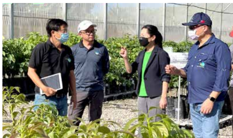
El Proyecto Reproducción de Plántulas Sanas de Aguacate beneficia a los productores, familias y asociaciones de viveristas.

El aporte de Misión Taiwán, a los productores hondureños se ha realizado de forma continua, logrando ejecutar diversos proyectos que son pilares en el desarrollo humano, el desarrollo familiar y económico de los agricultores tierra adentro: Proyecto Huanglongbing (Cítricos) en la Zona Norte: Atlántida, Proyecto de reproducción de tilapia en la zona sur: Choluteca; Proyecto Reproducción de Plántulas Sanas de Aguacate y Proyecto de Reproducción de Semilla de Papa Sana en la zona occidental: Intibucá. Así como cultivos de vegetales orientales, frutales, acuícola y proyecto porcino en la Zona Central: Comayagua y La Paz, Cultivos frutales y acuícola en la Zona Norte: Atlántida, Cortés y Yoro y cultivos frutales, acuícolas y vegetales en la Zona Oriental: Olancho, los cuales se han ejecutado en beneficio de los agricultores y agricultoras del país, incidiendo directamente en su desarrollo.