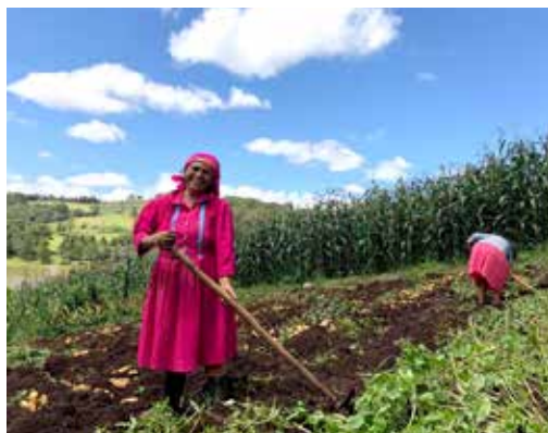
Con el proyecto de papa se da asistencia técnica a los productores.

Con los Proyectos de la Cooperación Técnica Agrícola se