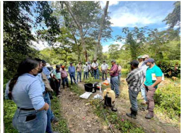
Los agricultores y agricultoras necesitan tener acceso a tecnologías y a entrenamiento en mejores prácticas agrícolas que les permitan tener productividad.