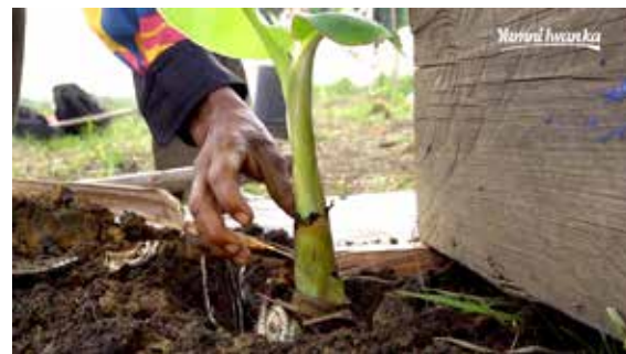
Las mujeres misquitas y sus familias han mejorado sus métodos de cultivo a través de capacitaciones y asistencia técnica.