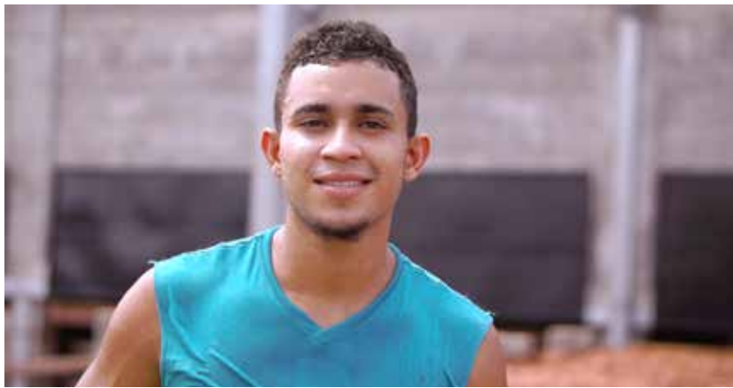
“Organizarse fue la mejor decisión” es la impresión hasta este día que miles de productores de cacao comentan