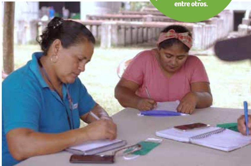
Las mujeres son parte de las juntas directivas y la toma de decisiones.