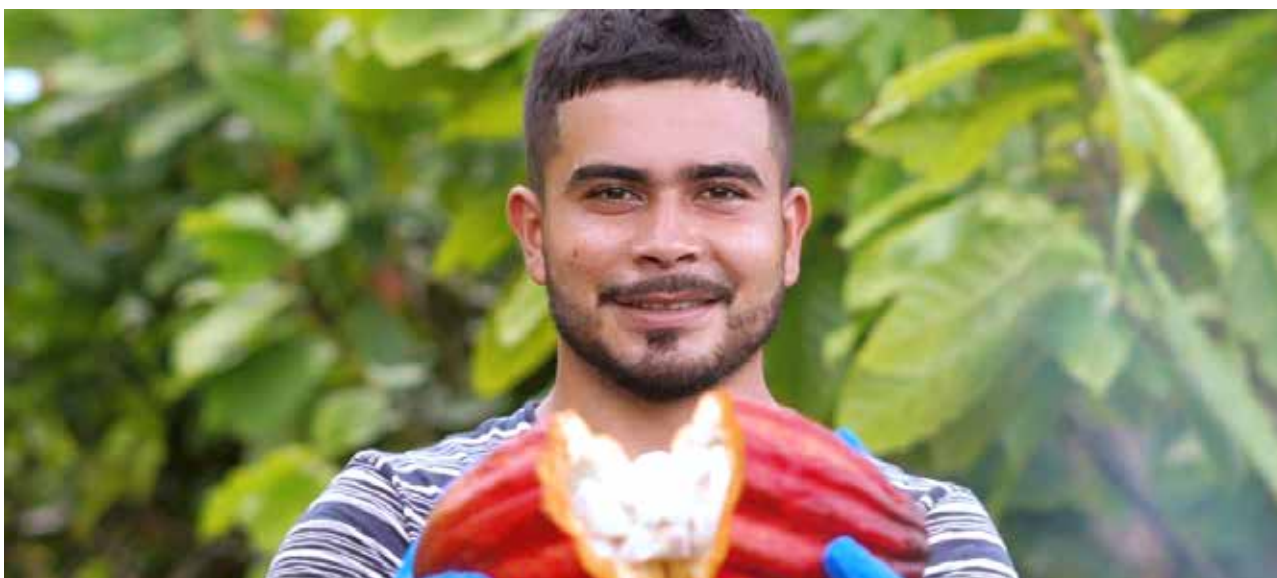
Honduras cultiva un cacao fino y de aroma y está entre los mejores del mundo.

En 2007 cooperantes y gobiernos amigos de Honduras, se han interesado en la producción de cacao, enfocándose en reestructuración, establecimiento de área, tecnologías, infraestructura, gobernanza entre otros.