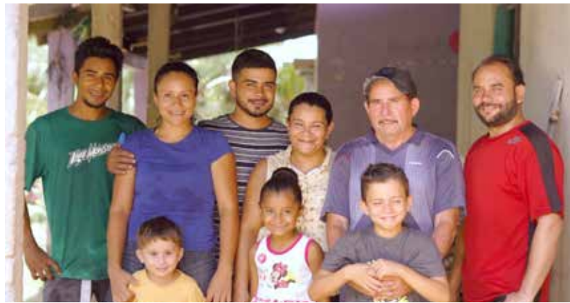
Hay 516 familias asociadas a empresas cacaoteras con acceso a educación financiera.