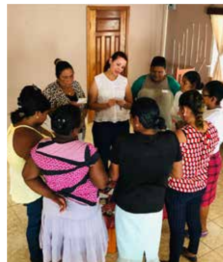
El programa EMPODERAT, orienta las acciones hacia la apropiación del grupo familiar y con ello se escala a nivel de comunidades los temas de participación y transformación de contextos, mostrando como resultado un mejor funcionamiento en sus núcleos familiares lo que se verá reflejado en los niveles de producción.

de ser comercializador, productor, de ser gestor de una ley, pero trata también de empoderar estos eslabones para trabajar de manera coordinada y articulada y llegar al fin común que es el mejoramiento de vida de miles de productores y productoras.