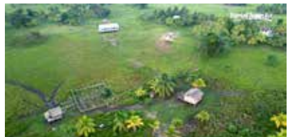
Comunidad de El Salto, en el corazón de La Mosquitia. 25 familias siembran legumbres y vegetales en huertos familiares.

Pero además, los comercializan para lograr una independencia económica con la generación de ingresos. Pero la cosa va mucho más allá: gracias a estos huertos, estas mujeres indígenas van ganando en empoderamiento e igualdad en sus propias comunidades.