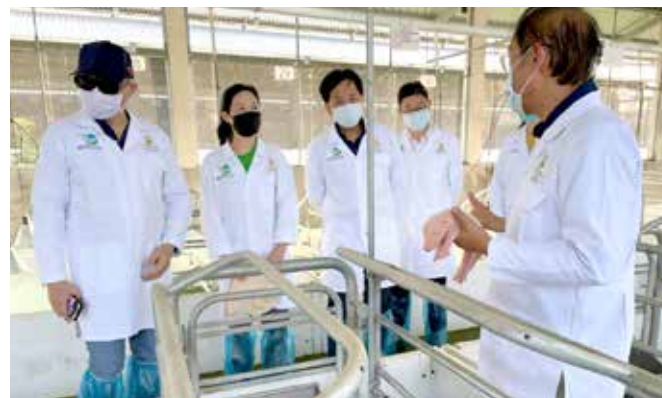
El Proyecto Porcino con la instalación de un Centro de Genética, considerado el más grande y tecnológico de Centroamérica para desarrollar la industria porcina hondureña.