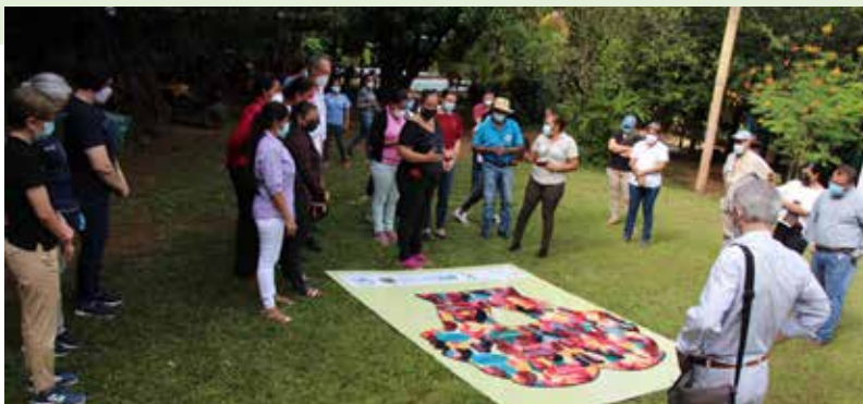
El programa Empoderamiento Transformativo con Enfoque Psicosocial EmPoderaT, es un programa que ha potenciado significativamente la sensibilización e implementación del enfoque psicosocial en programas de desarrollo y movimientos sociales apoyados por la COSUDE, en Honduras.

Dentro de sus programas y proyectos, surgió El programa Empoderamiento Transformativo, con Enfoque Psicosocial EmPoderaT, una innovadora y acertada iniciativa de programa cuyo objetivo es trabajar a la persona, el ser y sentir del individuo.