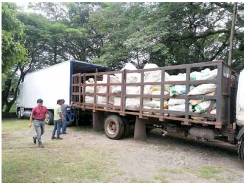
CampoLimpio SM en Honduras trabaja con la implementación de un nuevo modelo y se dispone a la construcción de centros de acopio.