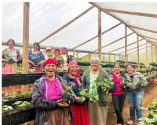
El proyecto de fresas suministra plántulas de alta calidad con una capacidad de 60,000 plántulas para los agricultores y también se utiliza para recoger diferentes variedades.