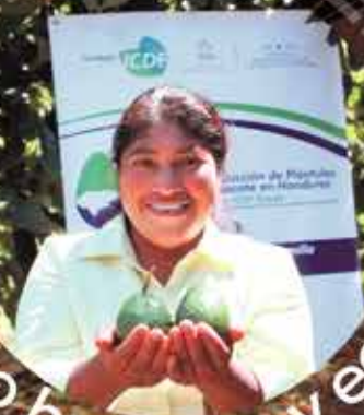
Crecimiento humano y económico