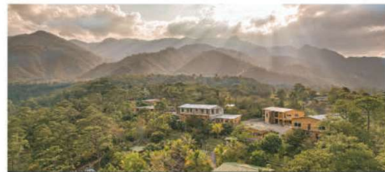
Aldea Villa Verde, 3.8 km carretera Parque Nacional Montaña de Celaque, Gracias, Lempira. Para mayor información: contactohotelvillaverdehn@gmail.com https://www.facebook.com/Hotelvillaverdehn

Villa Verde dispone de 23 amplias habitaciones, distribuidas en las categorías: