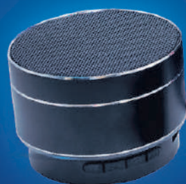
Parlante Inalámbrico incluido