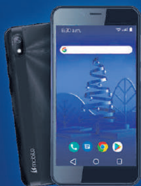
mobile BL 50 PRO*