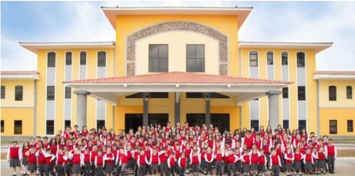
Ahora los Campus de WIS Honduras tendrán la oportunidad de brindar la doble titulación a todo su alumnado.