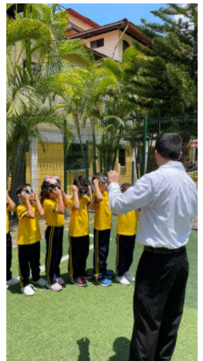
WIS Maestro Astronomía

joven de hoy está lleno de inquietudes y deseo de éxito, liderazgo y sobretodo metas muy claras. Con una malla curricular dinámica y que abarca todas las áreas del conocimiento, en Western International School la juventud hondureña puede encontrar su verdadera pasión y desarrollarla con miras a un brillante futuro.