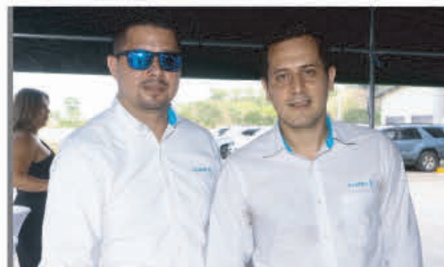
Invitados de VITAPRO.