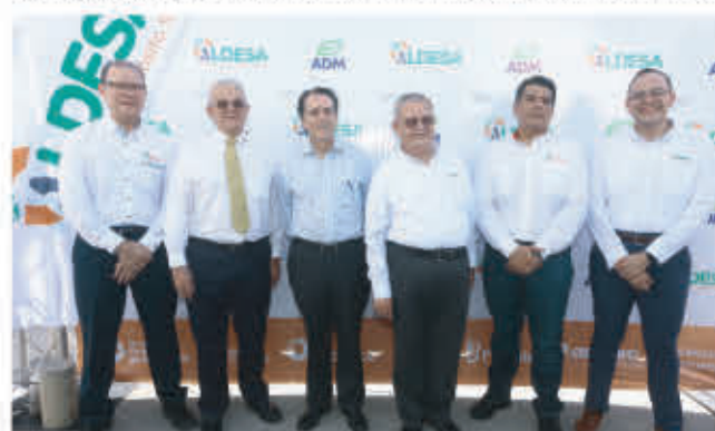
Miembros de la Junta Directiva de ALDESA.