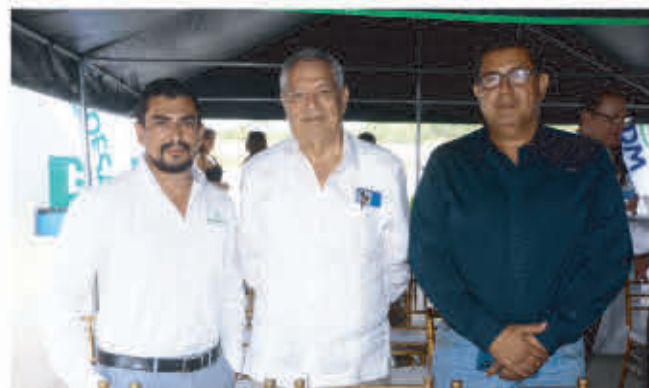
Invitados de INDUMECO