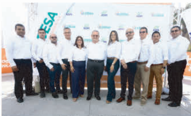
Ejecutivos y personal administrativo de ALDESA.