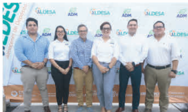
Ejecutivos y personal administrativo de ADM Honduras.