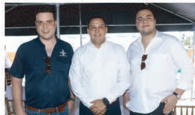
Invitados de Molino Harinero de Sula.