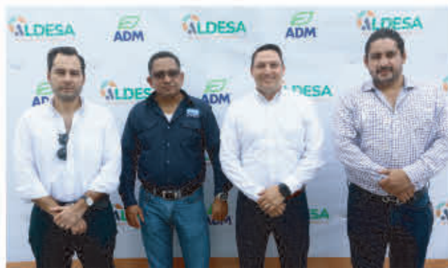
Invitados de Molino Harinero de Sula, AQUAFEED & ADM.