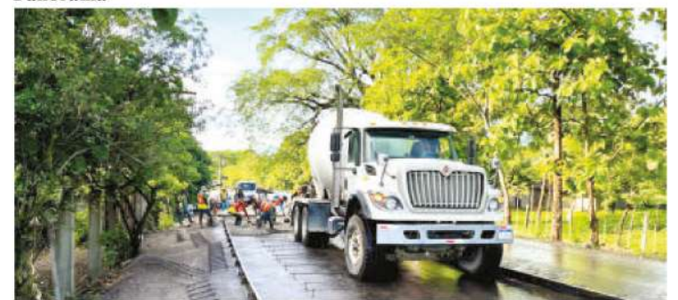
Tramo Carretero Amapa