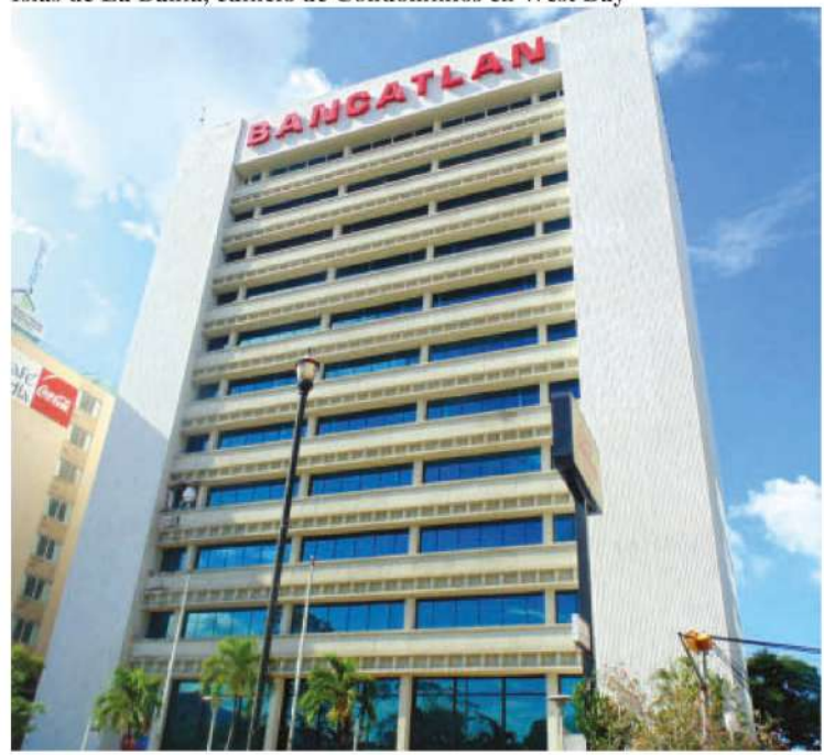
Edificio Banco Atlántida