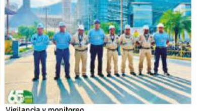
Vigilancia y monitoreo