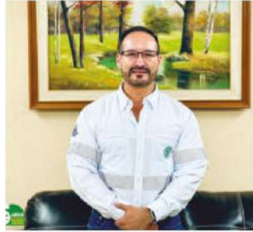
Gerencia Técnica: Ing. Rolando Arocha.