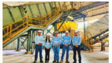
Gestión ambiental y combustibles alternos