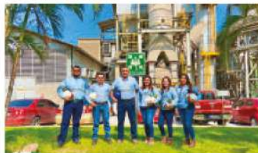
Higiene y seguridad industrial