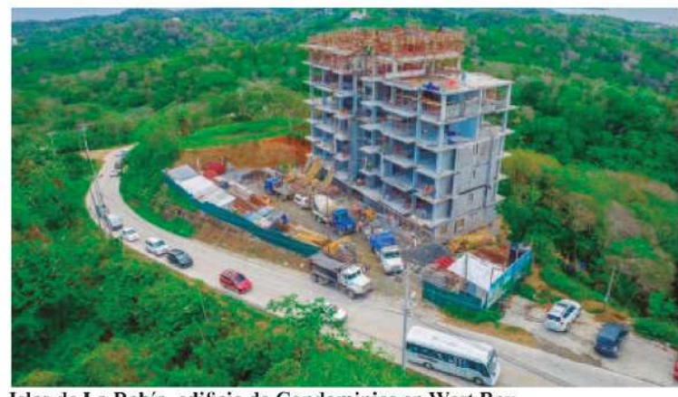
Islas de La Bahía, edificio de Condominios en West Bay