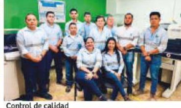
Control de calidad