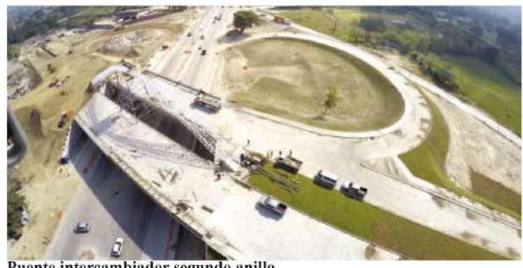
Puente intercambiador segundo anillo