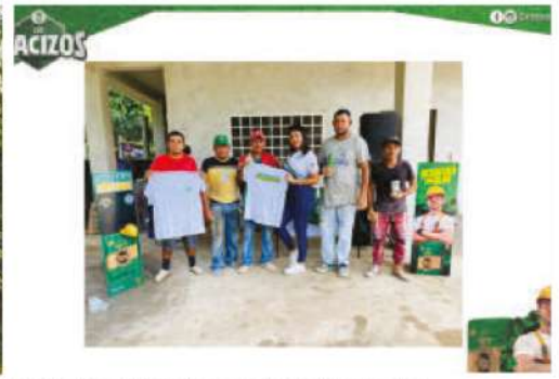
CENOSA ha participado en expo ferias, formaciones, capacitaciones y ha firmado convenios estratégicos para lograr que la producción de cemento en el país cumpla con las normativas internacionales.