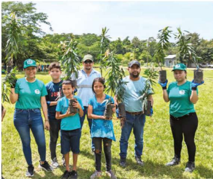
CENOSA realiza campañas de reforestación como parte de su labor social empresarial.

Cementos del Norte S.A., (CENOSA) se enorgullece en seguir trabajando por el desarrollo sostenible de las comunidades cercanas a sus operaciones.