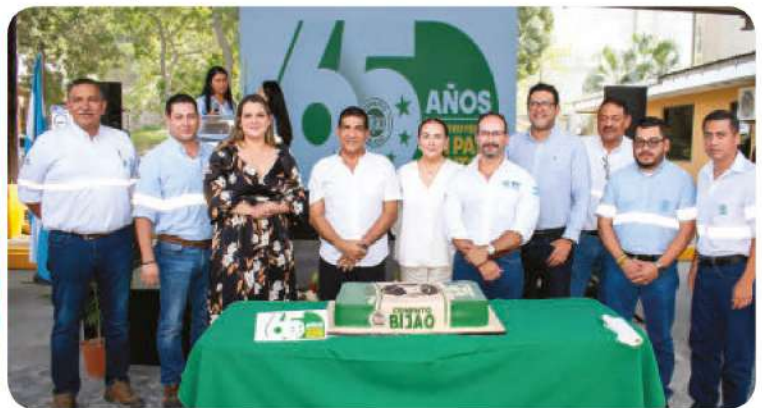
Ejecutivos de CENOSA durante la celebración de su 65 Aniversario de presencia en el país.