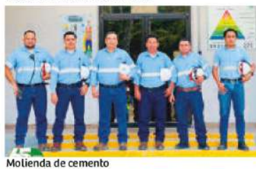
Molienda de cemento