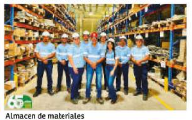
Almacen de materiales