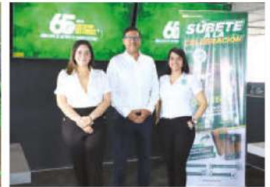
CENOSA a lo largo de su existencia ha sido un socio estratégico patrocinando muchos eventos de gran prestigio en el país, como ser la Maratón de diario La Prensa.