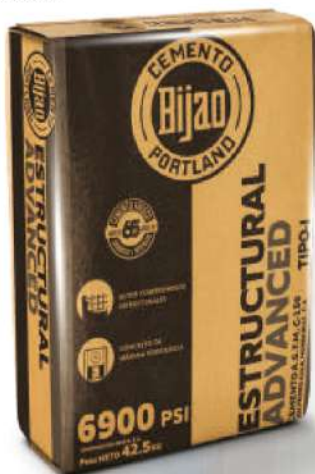
BIJAO LANZA SU BOLSA CONMEMORATIVA DEL 65 ANIVERSARIO

El uso sugerido de este cemento es para concretos de alta resistencia utilizados en obras con alto compromiso estructural en sus elementos; como ser: Puentes, Edificios, Pavimento columnas y Pisos industriales