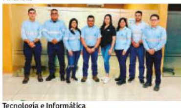
Tecnología e Informática